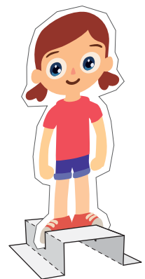
Stojánek na loutku