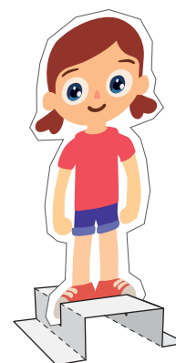
Stojánek na loutku